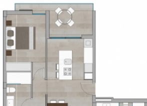
PLANTAS 2 y 3